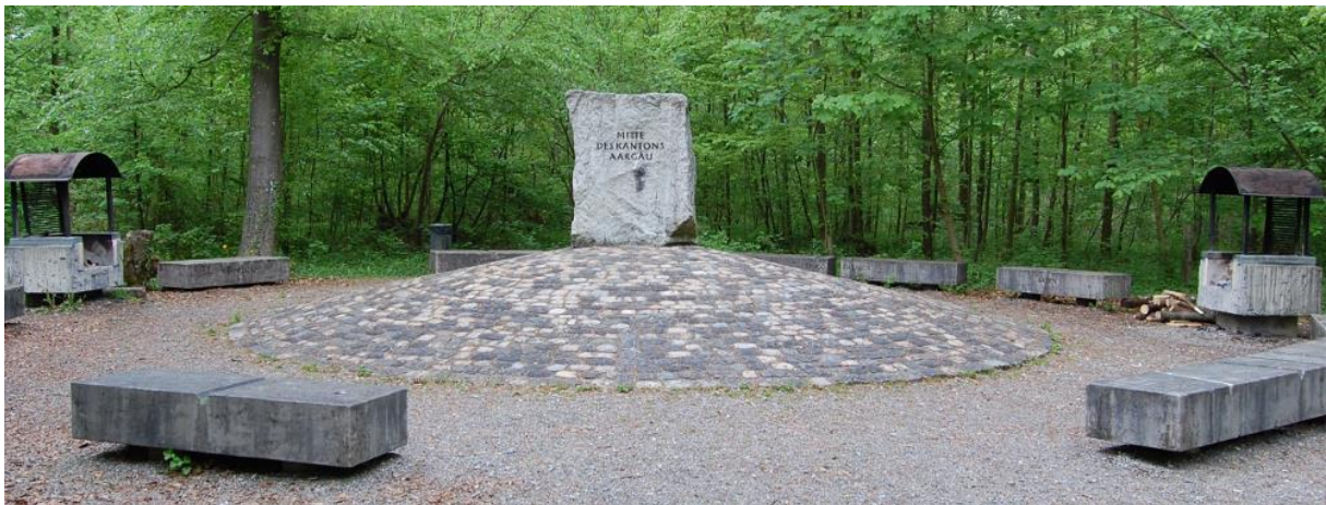
Mitte des Kantons Aargau